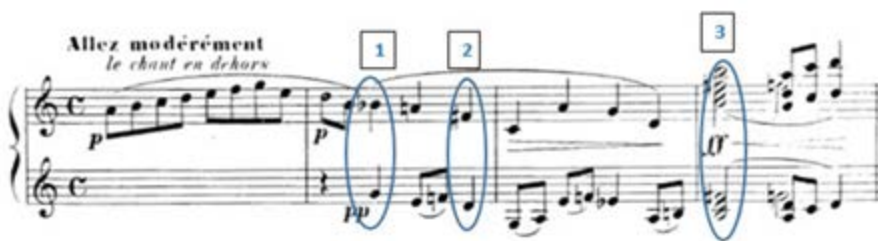
Figura 3. Partitura correspondiente a la sección de la introducción

Movimientos correspondientes a la intérprete de piano primo en la ejecución conjunta: