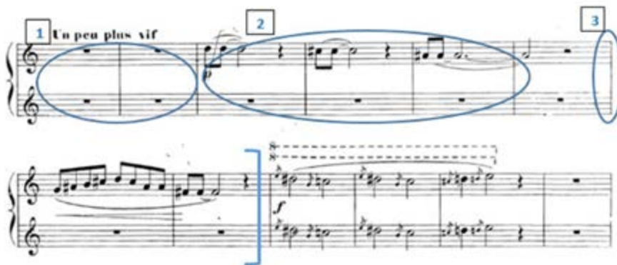
Figura 4. Partitura correspondiente a la unidad formal a

Movimientos correspondientes a la intérprete de piano primo en la ejecución conjunta: