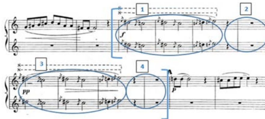
Figura 5. Partitura correspondiente a la unidad formal b

Movimientos correspondientes a la intérprete de piano primo en la ejecución conjunta: